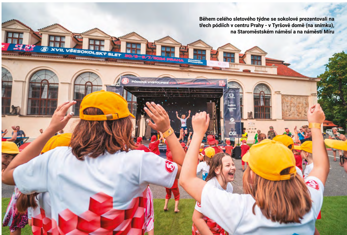
Během celého sletového týdne se sokolové prezentovali na třech pódích v centru Prahy - v Tyršově domě (na snímku), na Staroměstském náměstí a na náměstí Míru