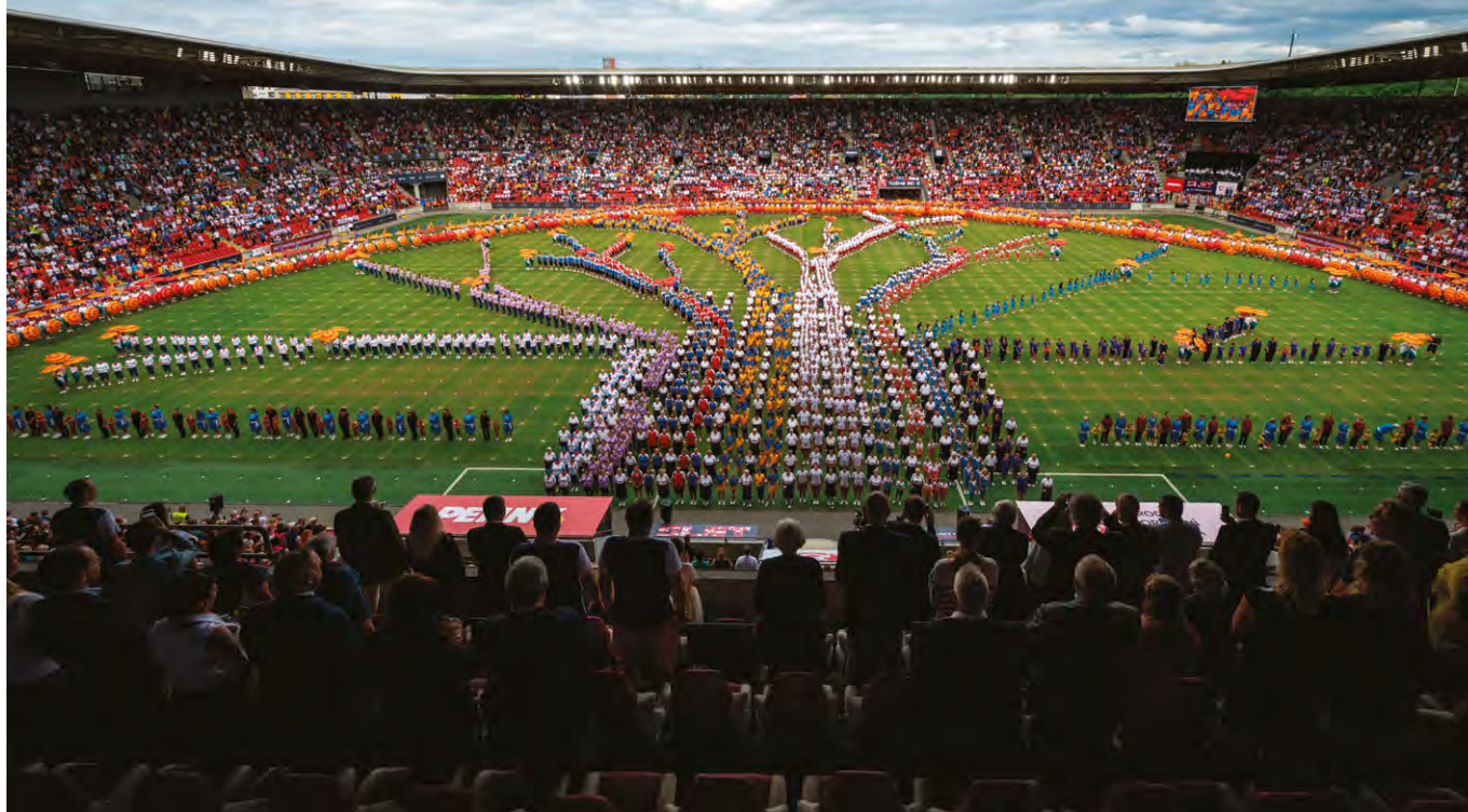
První program sledoval i prezident Petr Pavel, který hned v jeho úvodu předal sokolům prapor