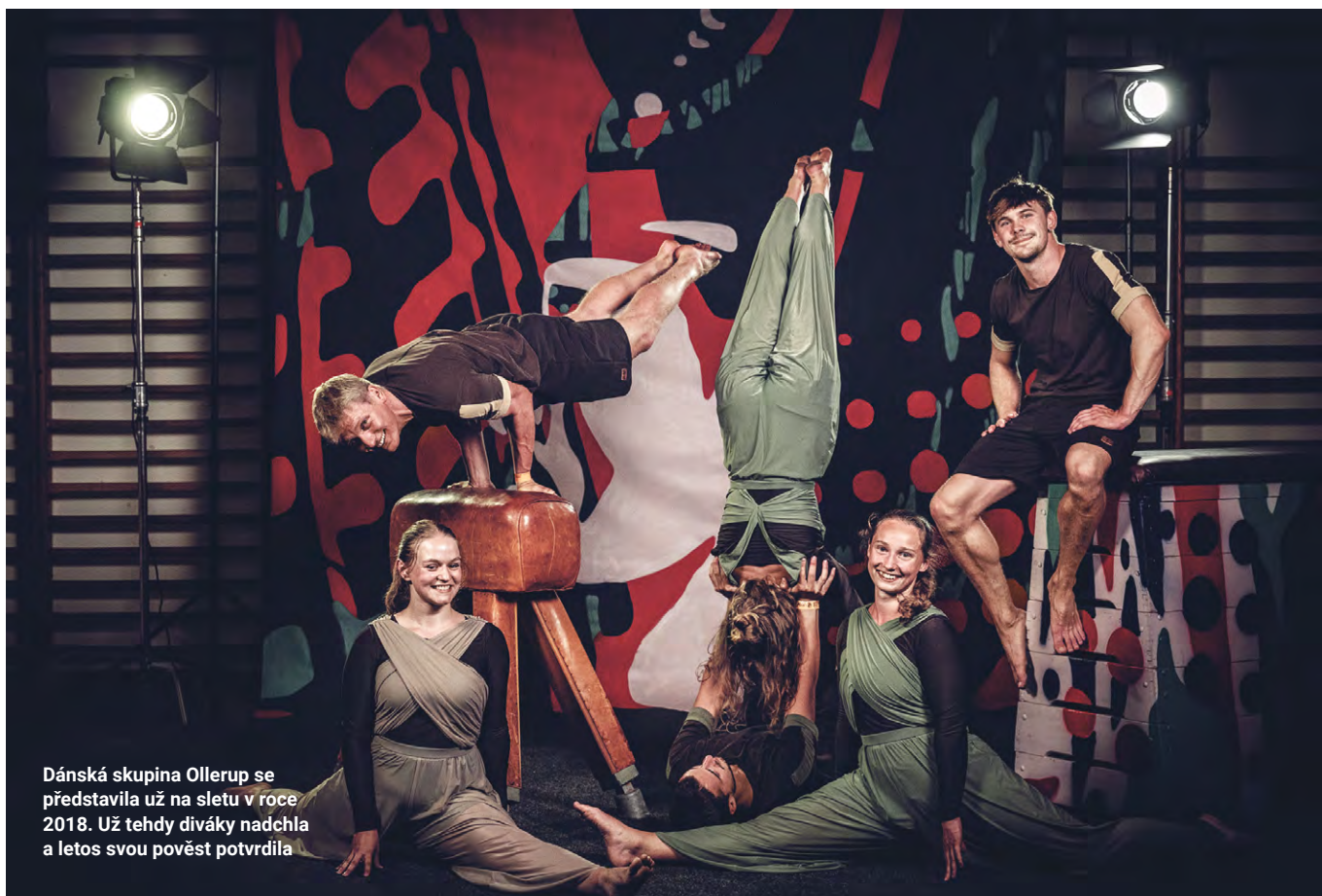
Dánská skupina Ollerup se představila už na sletu v roce 2018. Už tehdy diváky nadchla a letos svou pověst potvrdila