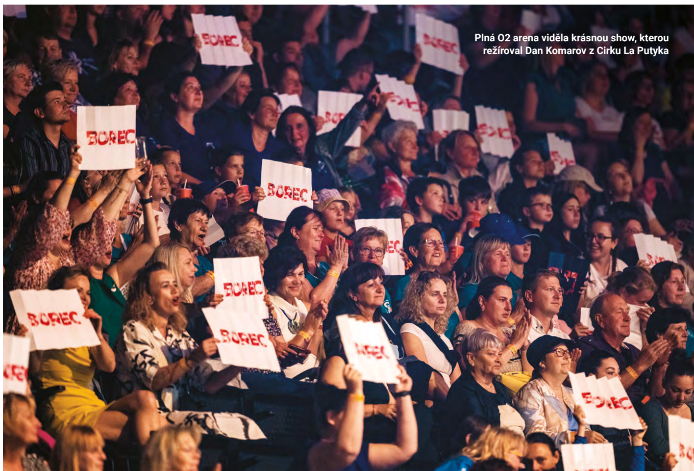
Plná O2 arena viděla krásnou show, kterou režíroval Dan Komarov z Cirku La Putyka