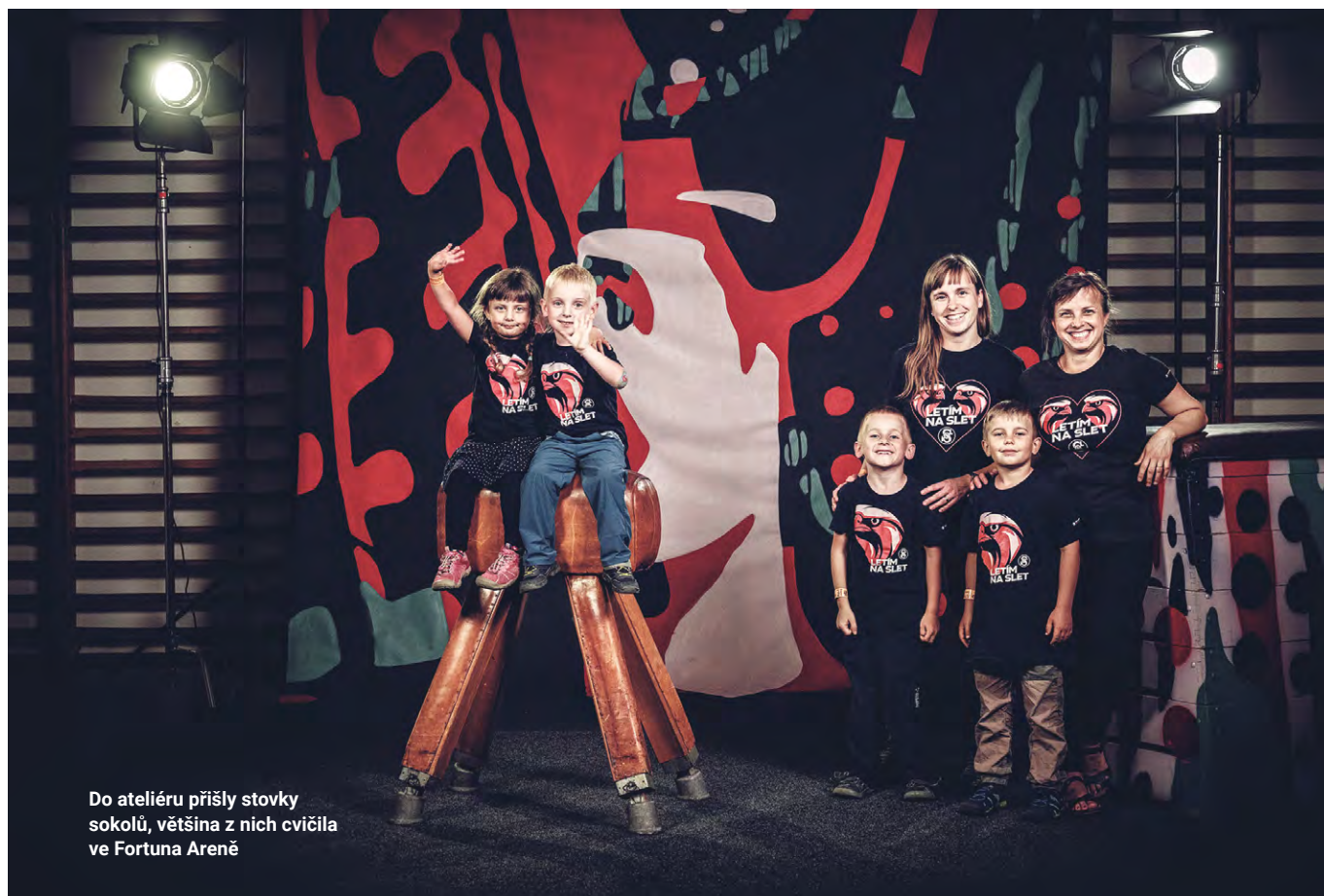
Do ateliéru přišly stovky sokolů, většina z nich cvičila ve Fortuna Areně