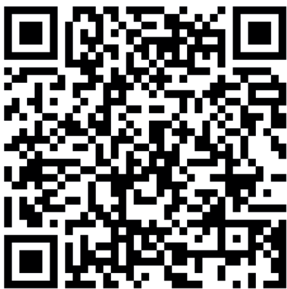
Formulář OSA pro ohlášení akce