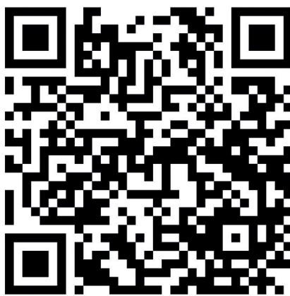
Formulář pro ohlášení prodeje lihovin