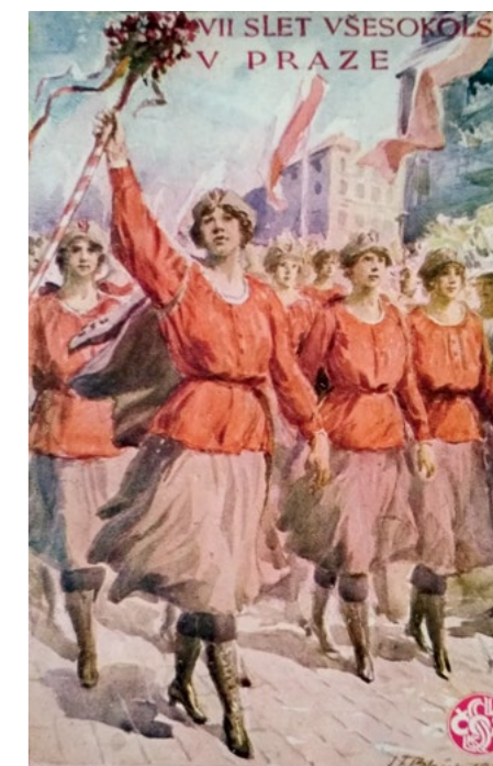
První oficiálně schválený ženský sokolský kroj stylizovaný na barevné pohlednici

ceptovány do 15 let, poté se již dívky měly připravovat na vstup do manželství a péči o domácnost. Sokol v čele s Miroslavem Tyršem, který sám mladé dívky cvičil, šel alespoň částečně proti proudu doby. Ač při samotném