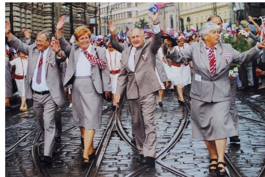
Průvod XIII. všesokolského sletu v roce 2000 a ukázka společenského oděvu