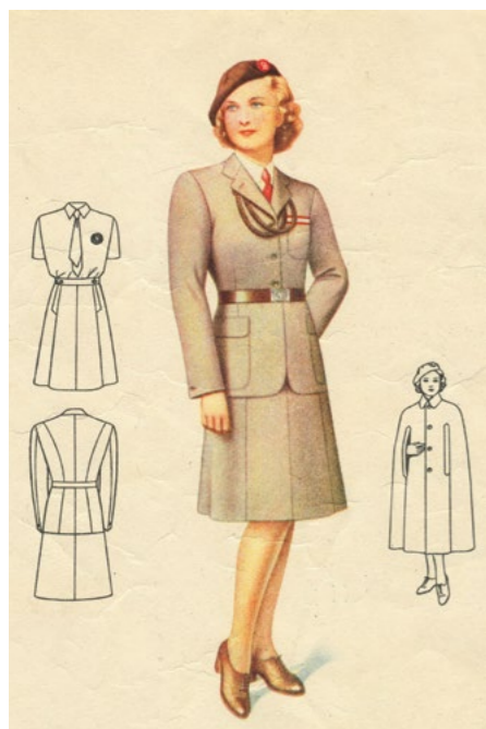
Podoba ženského sokolského kroje v roce 1948

Přes všechny komplikace nakonec firma Kras Boskovice dodala 396 konfekčně vyrobených oděvů, v Tyršově domě krojová komise nastříhala téměř 1000 metrů látky a po 500 metrech podšívkoviny a košiloviny. Ač měl tento sokolský oděv sloužit pouze jako jednotné moderní oblečení pro XII. všesokolský slet, sestry a bratři ho nosí dodnes vedle tradičních sokolských krojů.