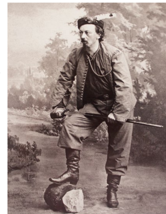
Miroslav Tyrš v sokolském kroji

Zatímco Fügner byl ve svých vizích poměrně umírněný, Tyrš přišel s mnohem odvážnější myšlenkou, jejíž stěžejní součástí bylo odstranění tolik přetřásané kajdy. Z Tyršova možného řešení byli nadšeni hlavně mladší sokolové, ti starší však byli až pohoršeni. Sám Tyrš při předkládání svého návrhu na úpravu kroje patrně ani netušil, jaké rozepře ve spolku jeho záměr vyvolá. Pro zakladatele Sokola byla na prvním místě pospolitost členů, a tak, dle památníku vydaného k dvacetiletému trvání Sokola Pražského, začal obházet bratry s prosbou, aby pro jeho návrh nehlasovali. V dubnu roku 1864 byla nakonec podoba kroje ustálena na základě kroje prvního.