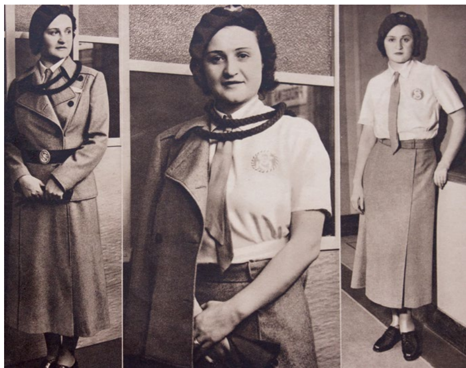
Návrh nového ženského kroje z 2. poloviny 30. let 20. století

založení Sokola nebylo myslitelné, aby ženy byly rovnoprávnými členkami, ovzduší se začalo pomalu uvolňovat a postupně se zrodila myšlenka na založení ženského tělocvičného spolku. Tak vznikl v roce 1869 Tělocvičný spolek paní a dívek pražských.