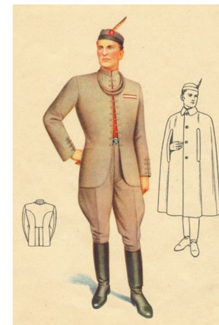
Tradiční mužský sokolský kroj a jeho podoba v roce 1948

Devatenácté století, či alespoň jeho první polovina, ukládala ženě její jasnou roli, která se neodehrávala ve veřejném prostoru. Ve stejném duchu se v podstatě přistupovalo i k pohybovým aktivitám dívek a žen. Ty byly ak-