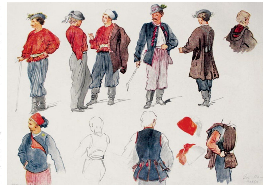
Mánesovy návrhy sokolského kroje

Ač se do konce šedesátých let 19. století objevovaly další hlasy volající po úpravách, kvůli propuknutí prusko-rakouské války v roce 1866, nebyly vyslyšeny. Otázka úpravy sokolského kroje tehdy jednoduše nebyla na pořadu dne.