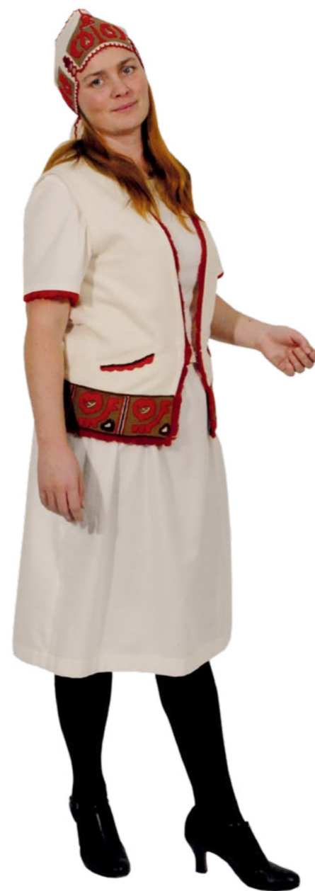
Kroj „Libuše“ je u mnohých sester oblíbený i dnes

Nabízí se otázka, proč se s každým novým návrhem na změnu kroje strhla horečná diskuze. Jedním ze stěžejních důvodů samotného vzniku sokolského stejnokroje bylo viditelné odstranění sociálních rozdílů mezi členstvem. Na druhou stranu bylo ale pořízení kompletního kroje velice nákladné a každá schválená změna znamenala nové výdaje. Proto v roce 1880 vznikla tzv. obleková komise, je-