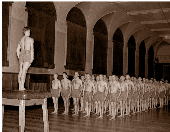
Velká tělocvična Tyršova domu – cvičení Úderných oddílů NSDAP (SA), 18. březen 1943

Fotografie z knihy Jana B. Uhlíře Protektorát Čechy a Morava 1939–1942. Srdce Třetí říše