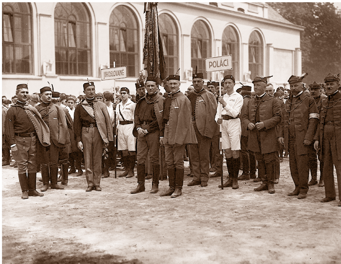
Při slavnostním otevření Tyršova domu dne 24. května 1925 se Masaryk odebral nejdříve do velké tělocvičny a následně do rizalitního sálu v prvním patře Michnova paláce, odkud sledoval příchod krojovaných sokolů a sokolek.

Zato Masarykova účast na slavnostním otevření Tyršova domu 24. května 1925, setkání prezidenta Beneše se sokolskými olympijskými družstvy v Tyršově domě 3. června 1936, jeho opětovná návštěva tohoto místa 20. března 1947 i příjezdy ministerských předsedů a členů vlád 24. května 1925 a 22. ledna 1948 se nesly v mimořádně ceremoniálním duchu, který svým patosem a rituály daleko předčil atmosféru návštěv osobností zmíněných v předchozím oddíle. Prezidenty a předsedy vlády většinou vítala mnohačlenná delegace nejvyšších činitelů ČOS, po chodbách a schodištích Tyršova domu se procházelo špalírem krojovaných sokolů a hosté se nezřídká zapisovali do pamětních