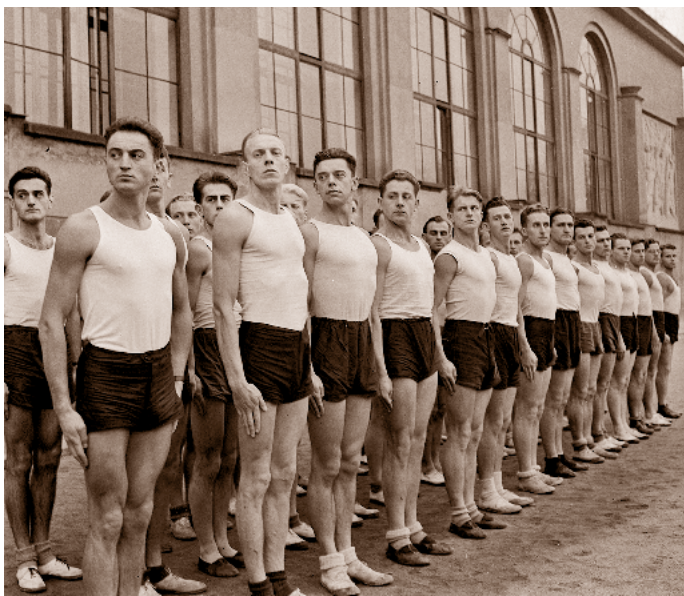
Frekventanti „vůdcovské školy“ Kuratoria pro výchovu mládeže v Čechách a na Moravě, 22. listopad 1942