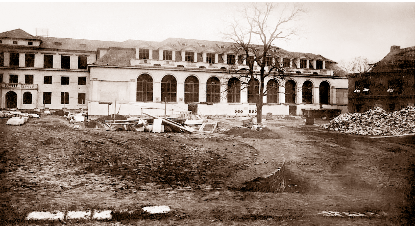
Novostavba velké tělocvičny, zima 1923

Slavnostní otevření Tyršova domu naplánoval Výbor ČOS na svém zasedání na počátku května 1925. Stanovil jej na 24. a 25. květen. Dne 24. května 1925 proběhl v Tyršově domě pracovní sjezd zástupců československých a jihoslovanských žup, který vyvrcholil slavnostním večerem ve velké tělocvičně. O den později byl Tyršův dům za přítomnosti prezidenta republiky, předsedy vlády, ministra zahraničních věcí, ministra obrany a pražského primátora slavnostně předán sokolské veřejnosti. Hlavními řečníky byli Tomáš G. Masaryk a starosta ČOS Josef Scheiner, jimž naslouchalo na 15 000 členů hnutí.