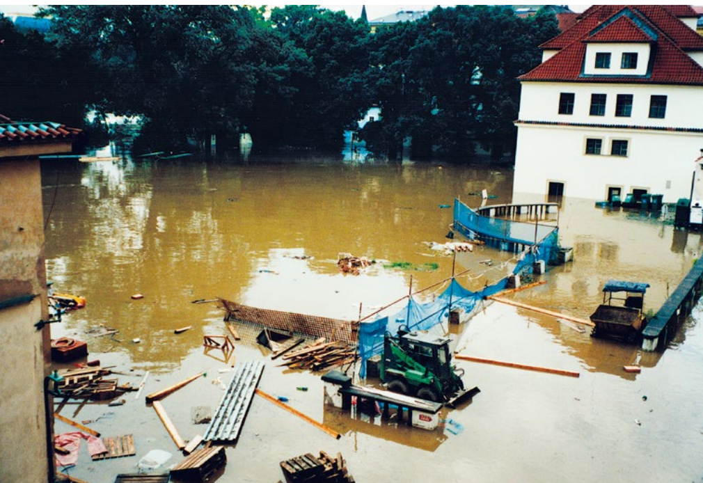
Záplavy, srpen 2002

se na zbytky bývalého mlýna s vodním kolem. Nad celým přízemkem je zřízen Sokolský domov (hotel). Letní cvičiště slouží všem druhům cviků. Rovná běžecká dráha jest 100 m dlouhá.