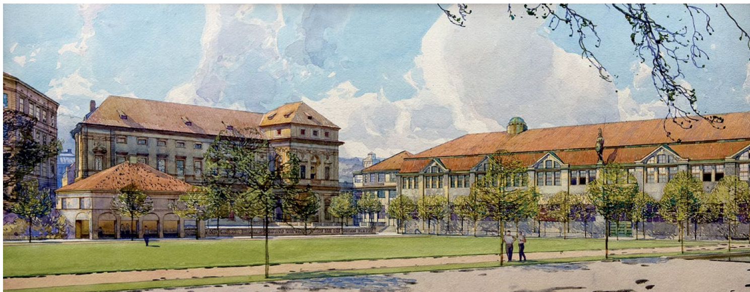
Jeden z nerealizovaných návrhů na revitalizaci Michnova paláce a dostavbu Tyršova domu, 1922

Rakouská, resp. rakousko-uherská armáda, která byla posledním majitelem Michnova paláce, se k tomuto baroknímu skvostu z let 1631–1644 chovala stejně macešsky, ba snad ještě hůře než armáda lidově demokratického Československa k zabraným historickým objektům po únoru 1948. Štukovou výzdobu pokrývalo místy až jedenáct vrstev nátěrů v tloušťce jednoho centimetru, vrstva sazí v improvizované kovárně dosáhla dokonce centimetrů tří. V nejreprezentativnější prostoře, Mramorovém sálu, byly „...ve stěnách zaraženy železné háky do hloubky 40 cm a vyčnívaly ven do místnosti 30 cm. Na tyto háky věšeli vojáci pušky, boty a jiné součásti výzbroje a potloukli stěny a stropy nemilosrdně.“ Na podlahu tohoto sálu položila armáda asfaltové dlaždice. Stavebně-historický průzkum vedl