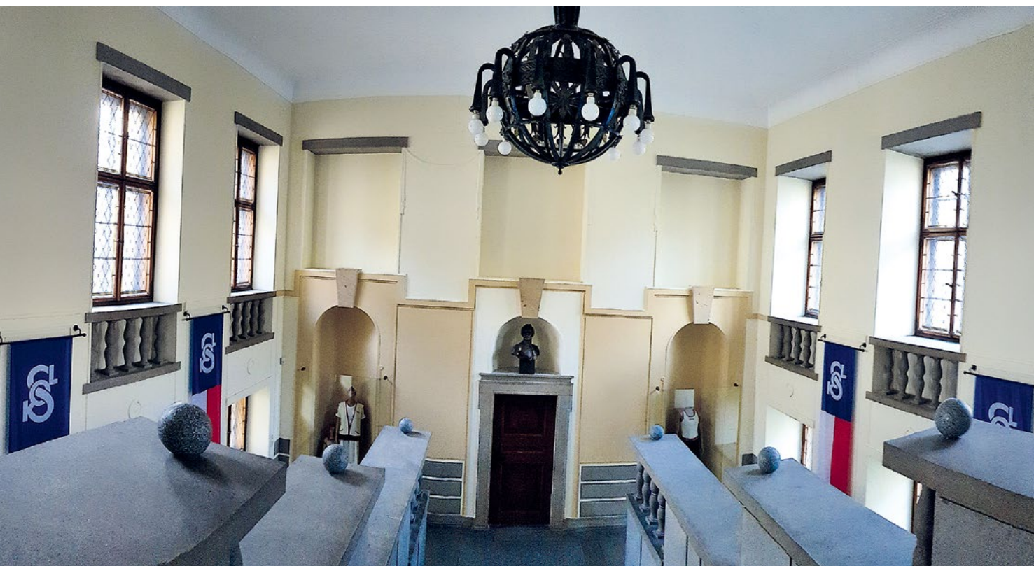
Současná úprava mezipatra u žulového schodiště v Michnově paláci s nově osazenou bystou dr. M. Tyrše