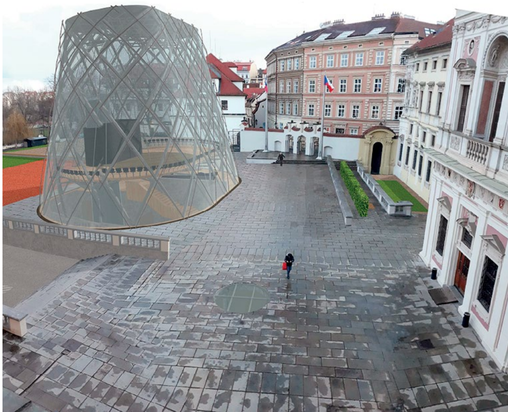
Budoucnost? Návrh na revitalizaci a dostavbu Tyršova domu architekta Josefa Pleskota

V letošním roce se podařilo vrátit do podoby z konce 30. let minulého století prostory u původního hlavního vchodu do Michnova paláce. Na své místo byla vrácena bysta spoluzakladatele Sokola, dr. Miroslava Tyrše a obě strany žulového schodiště byly vyzdobeny prapory ČOS. Obnovena byla rovněž boční fasáda Michnova paláce směřující do Všehrdovy ulice, která nese renesanční sgrafitovou výzdobu.