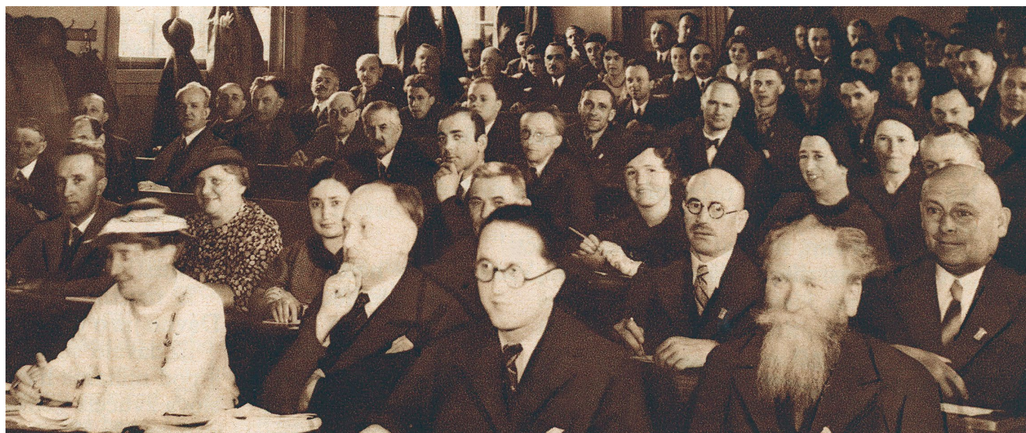
Účastníci sjezdu sokolských loutkářů 1. května 1936 v Tyršově domě pod předsednictvím vzdělavatele ČOS

Zpráva vzdělavatele v zápise o schůzi výboru ČOS v květnu 1928 obsahuje zajímavé informace o věkovém a profesním složení vzdělavatelů žup. Pozornost přitom byla věnována i tomu, zda jednotliví vzdělavatelé cvičí, nebo ne. Tak tedy z 53 župních vzdělavatelů 27 stále cvičilo, 22 cvičilo dříve, ale nyní již ne a jen 3 necvičili nikdy. Celkem 16 župních vzdělavatelů bylo zároveň i cvičiteli, jeden působil i jako náčelník župy, jeden jako místonáčelník župy. Z hle-