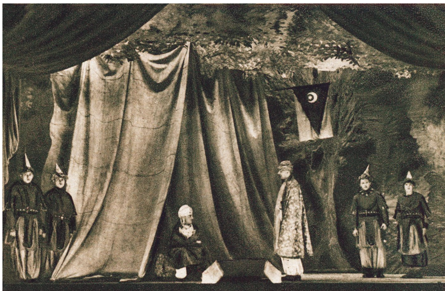
V roce 1932 se do programu IX. všesokolského sletu dostaly poprvé i vzdě-lávací soutěže: ochotnická, loutkářská a pěvecká. Na fotografii ukázka z vítěz-ného představení „Princezna Pampeliška“ v podání Sokola Blansko

Hned v počátcích svého působení bratr Hiller velmi úzce propojil prá-ci vzdělávací s prací tělocvičnou.