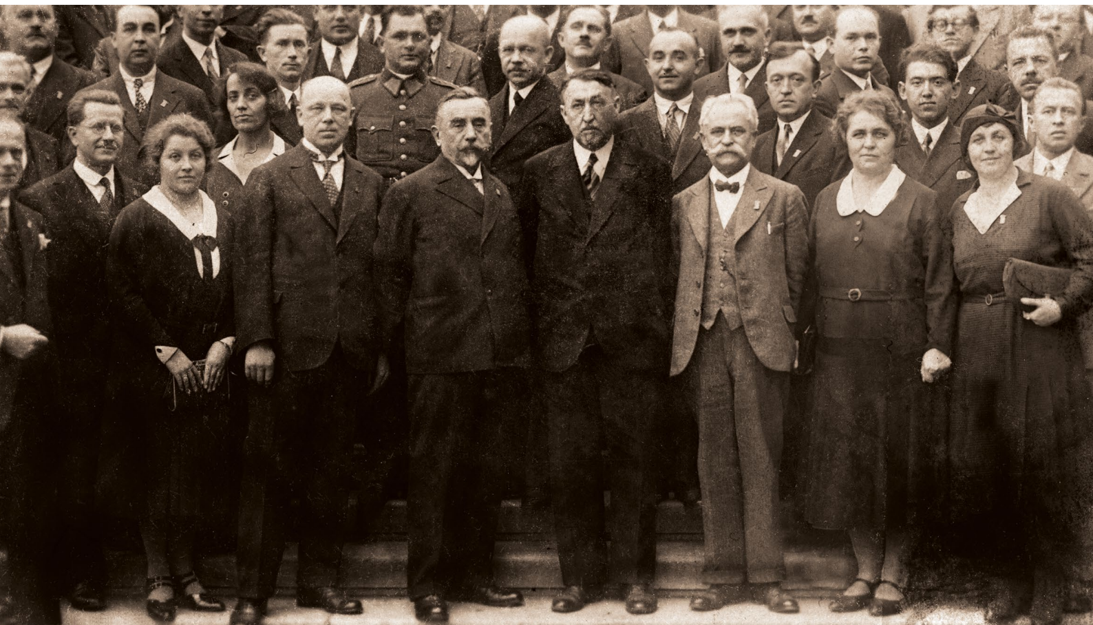
Schůze župního vzdělávacího sboru ČOS v roce 1931

VI. valný sjezd konaný 30. června 1920 na sletišti během VII. všesokolského sletu výrazně změnil stanovky ČOS, což ovlivnilo postavení vzdělávacích sborů v rámci celé organizace. V čele vzdělávací činnosti stanul vzdělavatel