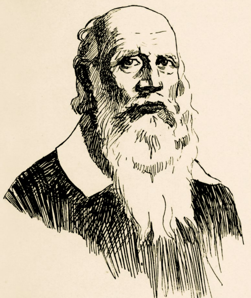
Ačkoli Friedrich Ludwig Jahn založil první turnerské cvičiště již ve svých 33 letech, zobrazován bývá většinou jako stařec s dlouhým bílým vousem.