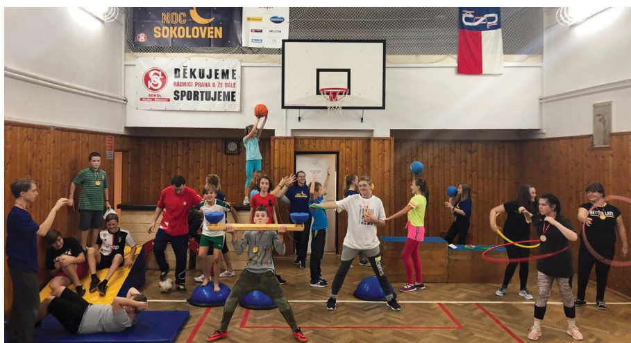
Noc sokoloven 2019 v Břevnově a živý obraz na téma Jak se cvičí v Sokole

sokolských souborů v Kyjově. Záměrem vzdělavatelů bylo právě představit postupně se obnovující sokolské kulturní soubory. Většina z nich začínala od začátku a téměř z ničeho, což potvrdilo například i první setkání ochotníků a loutkářů v říjnu 1993. Soubory se potýkaly s malým počtem členů většinou pokročilého věku a se ztíženým provozem způsobeným procesem vracení sokoloven do rukou jednot. Postupně se naštěstí dařilo situaci sokolských kulturních sborů konsolidovat, úspěšně se představily na XII. všesokolském sletu v roce 1994 či na první sokolské gymnestrádě v červnu 1996. Následně se kulturní vystoupení souborů stala nedílnou součástí velkých sokolských akcí. Podařilo se navázat na tradici kulturních přehlídek a v jejich rámci se dodnes každý rok představují odvětví sokolské kultury.