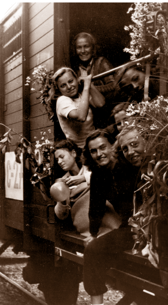
Příjezd do sletové Prahy