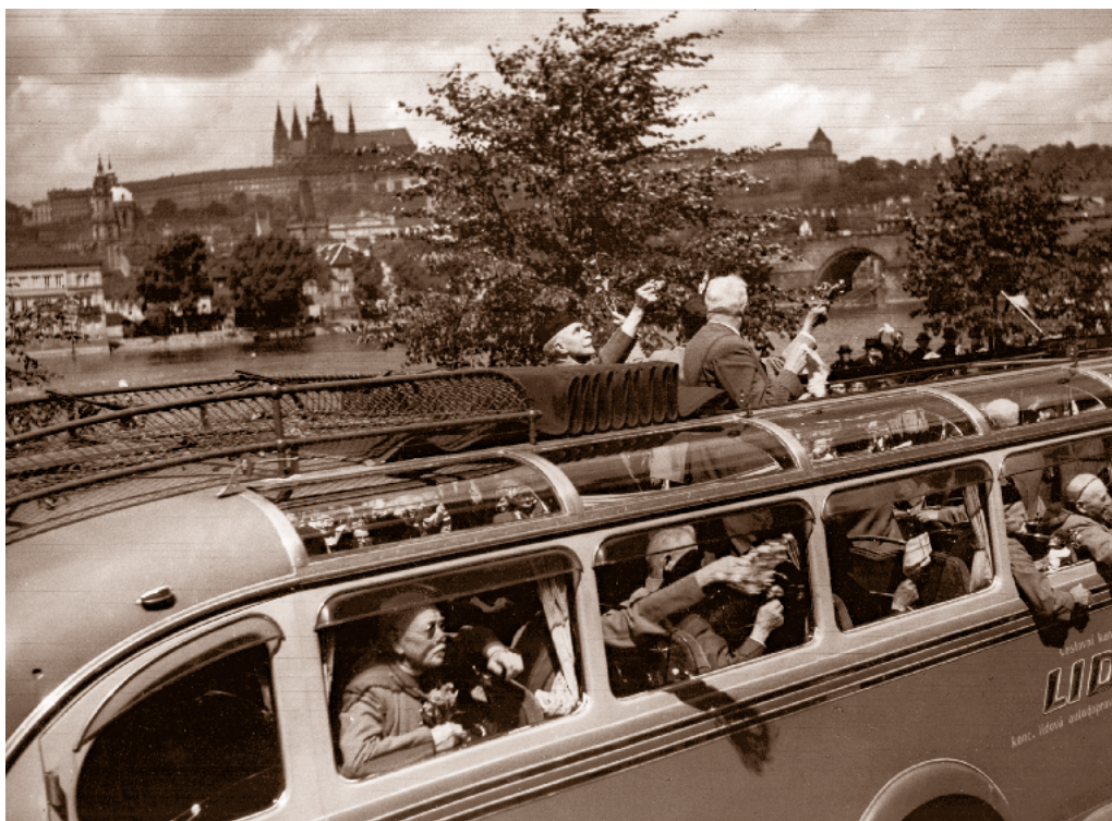
Účastníci I. a II. sletu byli ve sletovém průvodu vezeni autobusy, Masarykovo nábřeží (nyní Smetanovo nábřeží), 6. červenec 1938

a československou hymnou. „Kde domov můj“ zpívalo vstojí téměř čtvrt milionu diváků. Byla středa, 6. července 1938, 20,05 hod. a X. jubilejní všesokolský slet se právě stal minulostí.