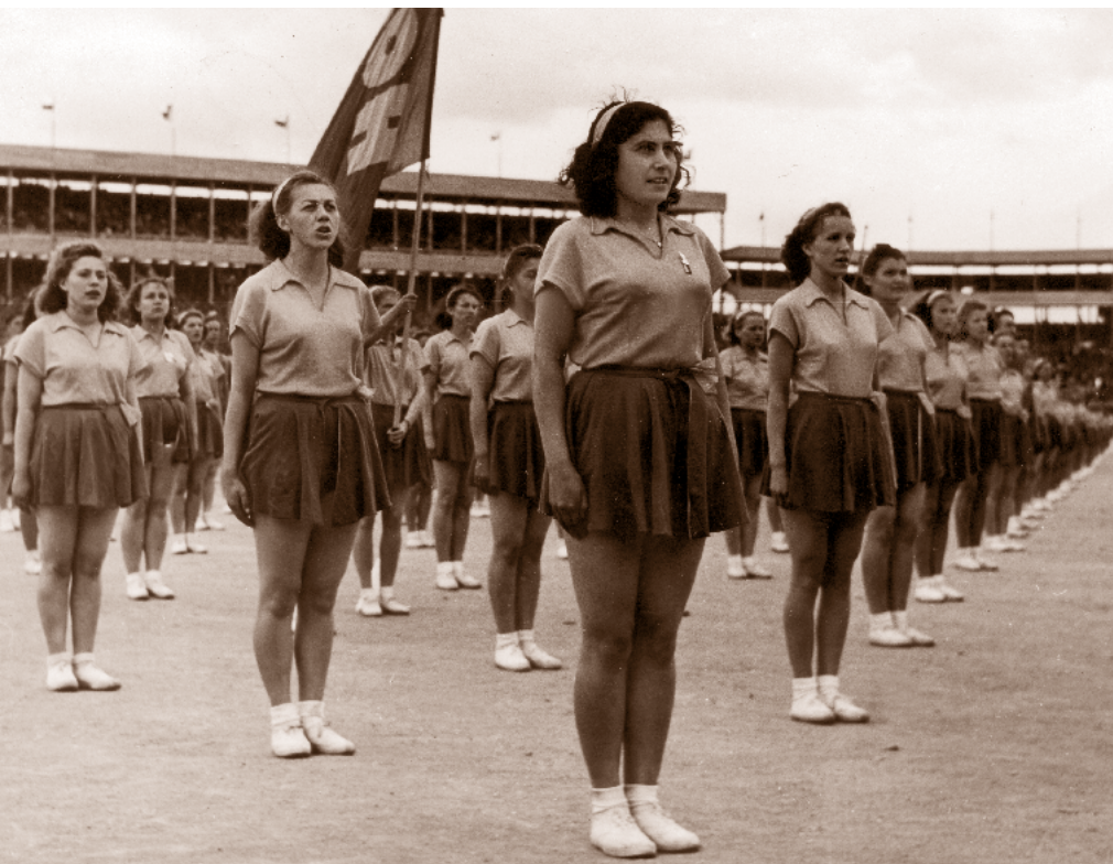
Součástí sletu se stala i organizátorům vnucená skladba Revolučního odborového hnutí (ROH) zahájená zpěvem Písň práce