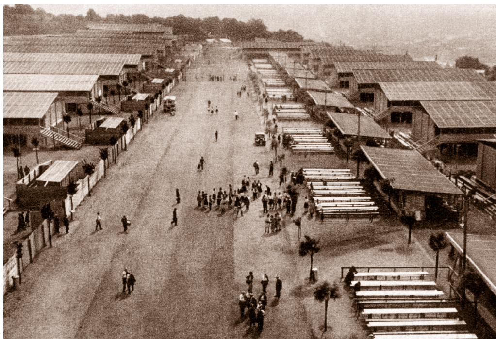
Šatny a seřadiště

Dalo by se psát dál a dál, pootevřít dveře pracoven dalších sletových odborů. Snad alespoň tímto krátkým ohlednutím jsme se na chvíli dostali do zákulisí velkého sokolského svátku, tam, kam oko diváka nevidí. A nejde jen o prostor jako takový, jde především o všechnu tu obdivuhodnou snahu a nezdolnou práci sester a bratrů, jejichž společným cílem bylo, aby se X. všesokolský slet v roce 1938 vydařil. A to se jim podařilo!