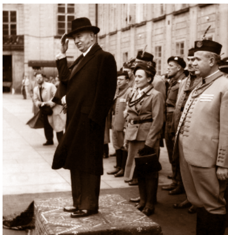
Prezident Beneš s vedením ČOS 28. září 1945 na Pražském hradě