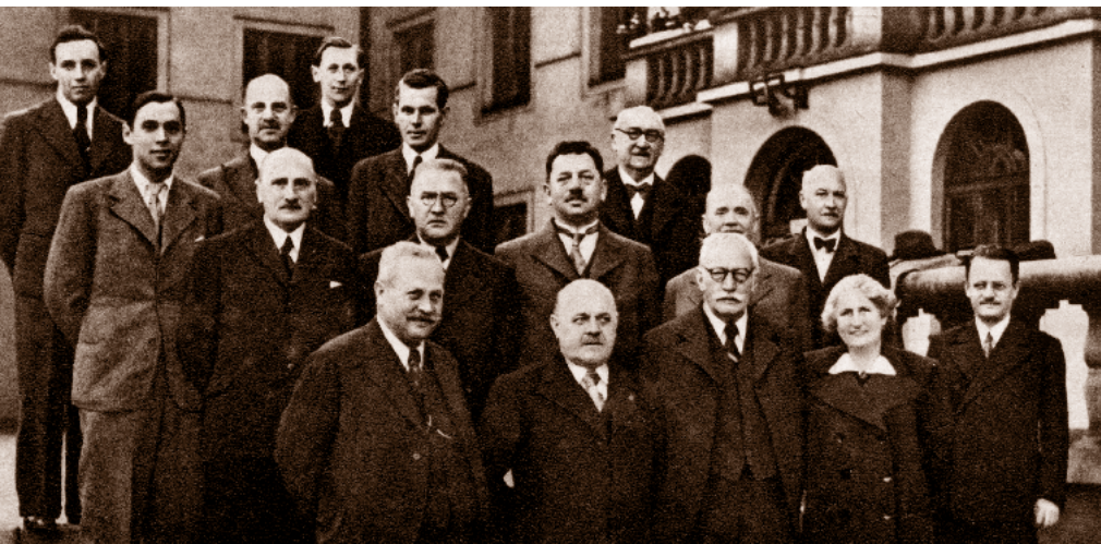
Stavební odbor X. všesokolského sletu

Jestli opravdu bylo nějaké místo ze zázemí X. všesokolského sletu skryto očím návštěvníků, byly to sletové kuchyně – sokolská továrna na pokrmy, jak se doslova píše ve sletovém památníku. Ty zaujímaly vedle administrativní budovy značnou část prostoru šaten. Šlo o 17 přístřešků vybavených kotly různého objemu. Každá z kuchyní byla schopna připravit asi 2 000 obědů, polévku a příkrm. Za 100 minut byly vydány obědy pro 32 000