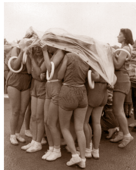
Dorostenky se skrývají před deštěm, který jakoby symbolizoval časy příští

Sokolská organizace přestala po 90 letech existovat. Komunisté největší český národní spolek zlikvidovali. Sokol a jeho ideály ale přesto žily dál. Řada účastníků XI. sletu, kteří pokračovali ve cvičení, se snažila udržet