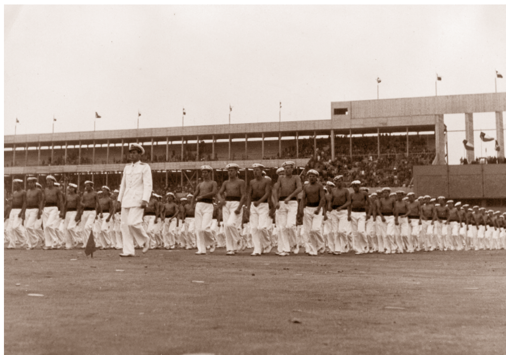
Cvičení jugoslávského námořnictva připomnělo slavné předválečné slety. Skutečnost, že Jugoslávie krátce před sletem opustila sovětský blok, přinesla cvičencům obrovské ovace.