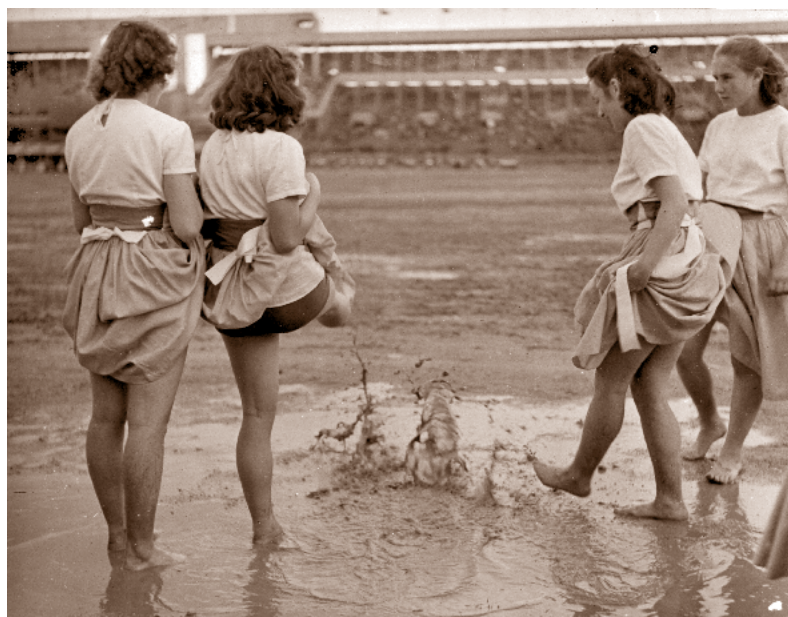
Odhodlání překonalo i nepřízeň počasí