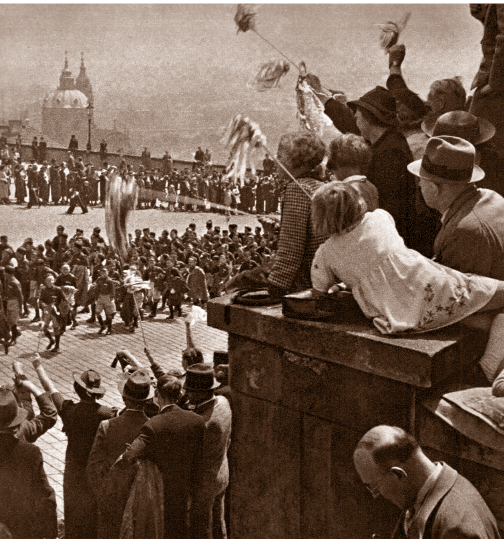
Sletový průvod žactva pražských žup, Hradčanské náměstí, 2. červenec 1938

První cvičení, nazvané „Sokolská brannost“, předvedlo 1 600 vybraných mužů. Po výměně darů mezi ČOS a Svazem Sokola Království Jugoslávie nastoupilo na cvičební plochu 16 000 žen k první části prostných. Následující prostná předvedla skupina 2 000 jugoslávských žen a mužů, které vzápětí vystřídalo téměř 5 000 cvičenek ČOS s míči. Závěrečným a nejmohutnějším cvi-