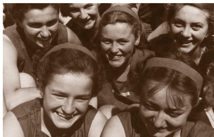
Naděšené účastnice bylo patrné ve chvílích cvičení i odpočinku