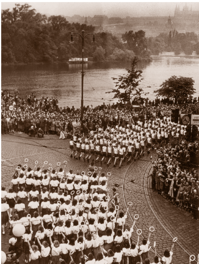
Sokolský dorost mívá Národní divadlo