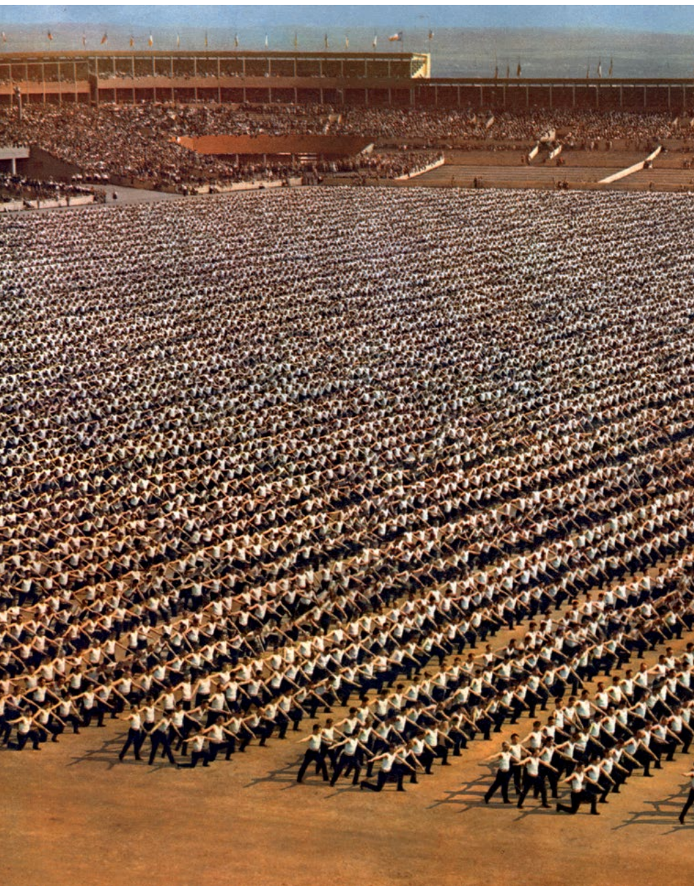
Mužská prostná „Přísaha republice“, Masarykův stadion, 3. červenec 1938

Trasa vedla ze Sokolské třídy Mezibranskou ulicí na Václavské náměstí, ulicí 28. října, Jungmannovou, Lazarskou a Myslíkovou přes Riegerovo a Masarykovo nábřeží, Křižovnickou na náměstí Bedřicha Smetany a kolem budovy právnické fakulty, u níž byli shromážděni děkani Karlovy univerzity ve slavnostních talárech a pedelové s historickými insigniemi, Pařížskou třídou na Staroměstské náměstí. Celý průvod trval více než 4 hod. a účastnilo se jej 73 418 osob. Bylo v něm neseno 1 189 praporů a vlajek. Oproti průvodu IX. sletu byl počet jeho účastníků o 7 890 vyšší.