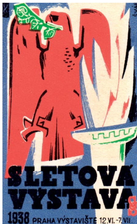
Zálepka informující o sletové výstavě na pražském Výstavišti