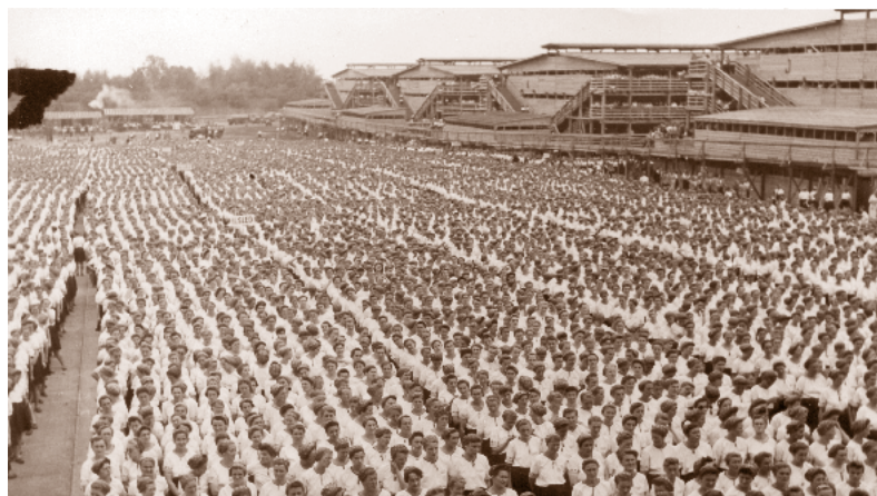
Ženy se chystají na strahovském seřadišti na své vystoupení