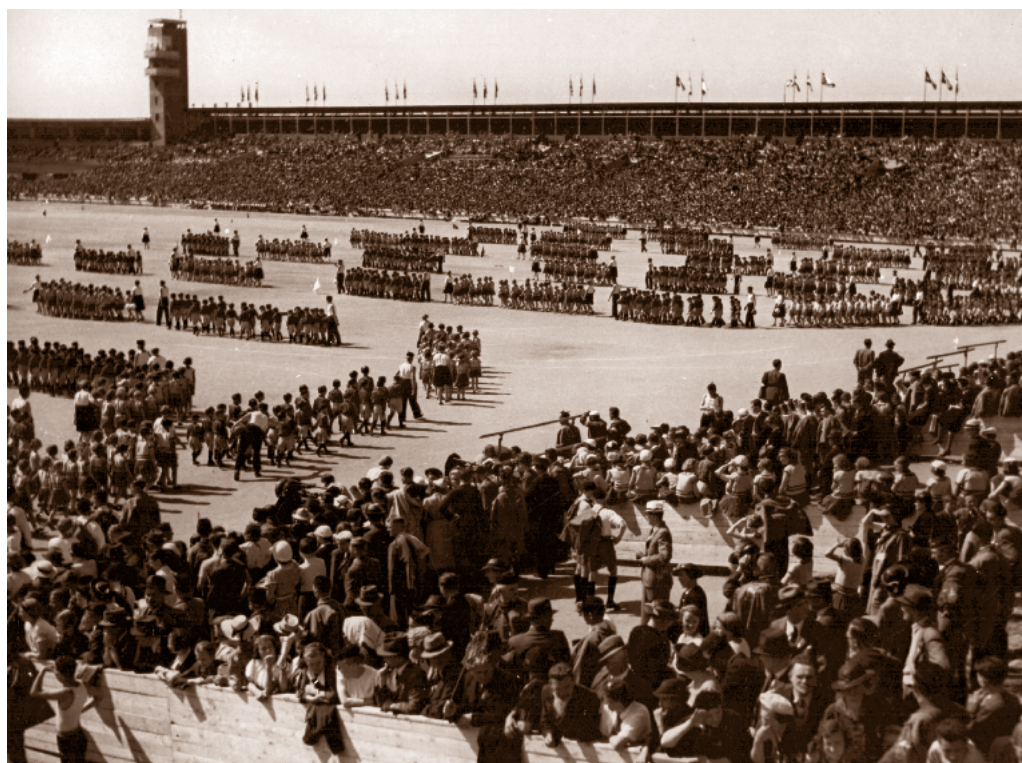
Nástup žactva pražských žup, Masarykův stadion, 2. červenec 1938