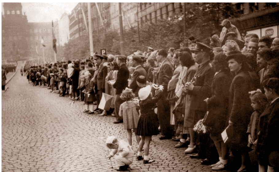
Tisícové davy lemovaly trasu památného sletového průvodu