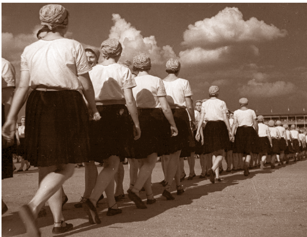
Nástup žen, Masarykův stadion, 3. července 1938

5. července byl ve znamení vystoupení zahraničních cvičenců. Odpolední pořad začal ve 14,52 hod. Poslední Přísaha republiky skončila naprostým úspěchem. Ženská protná předvedlo za hustého deště více než