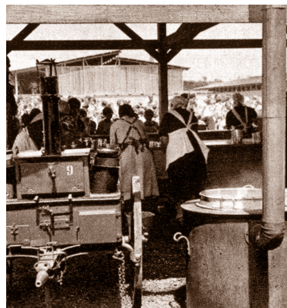
Ze sletové kuchyně

Během sletových dnů fungovaly naplno všechny ošetřovny a denní účast lékařů se pohybovala kolem 150.