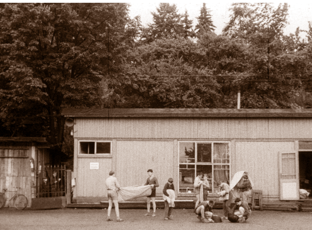
Hoši od Bobří řeky před klubovnou na Horním hřišti