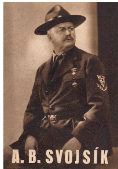
Obrázek na titulní straně je z knihy Skauting a sokolstvo od E. Chalupného.