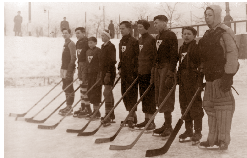
Skautská ilegální družina v KČT v roce 1944