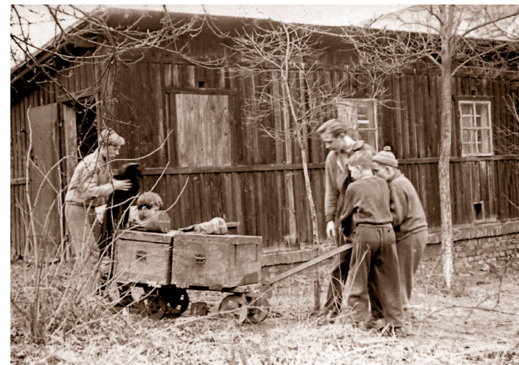
V roce 1958 se oddíl stěhoval z klubovny ve Srubu do klubovny na Horním hřišti.