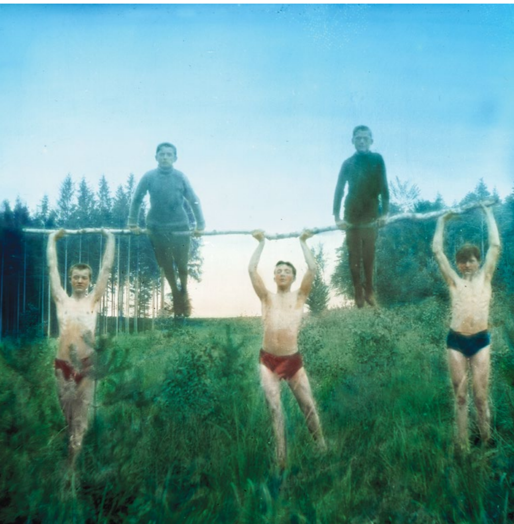
Ukázka cvičení skautů během letního tábora z broužury Den v táboře junáků

přizpůsobit, nešlo podle Svojsíka argumentovat, že skauting bude stejně militantní, jako měl být v Německu nebo polské Haliči. Český zakladatel rovněž souhlasil s Cvičitelským odborem, že se měl zavádět postupně, nemělo ale dojít k přebírání pouze několika prvků, ale k využití celé metody. Sokol pak měl skautingu poskytnout dobré zázemí, které by pomohlo v jeho rychlém rozvoji.