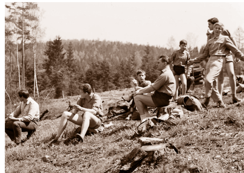
Výprava do Ztraceného údolí v roce 1967

Ačkoli se poměry okolo vydávání Foglarových knih v 60. letech zlepšily, během normalizace zůstával nadále personou non grata, což se změnilo s pádem minulého režimu. Odmítán byl i rukopis jeho životopisu Život v poklusu , a to až do roku 1989, kdy se jej ve dvou dílech rozhodla vydat T. J. Sokol Silůvky. Výborné obálky nakreslil Kája Saudek. Ve stejné době jednota vydala i Foglarovu hru Alvarez . Silůvští se stále k těmto významným počínům hlásí a navazují na tuto tradici. Sokol i Skaut zde mají dlouholetou historii, která se vzájemně proplétá. Skautský oddíl Sokolík Silůvky má za sebou více než 75letou historii. Ani jednou oddíl nepřerušil činnost, a to i díky tomu, že během