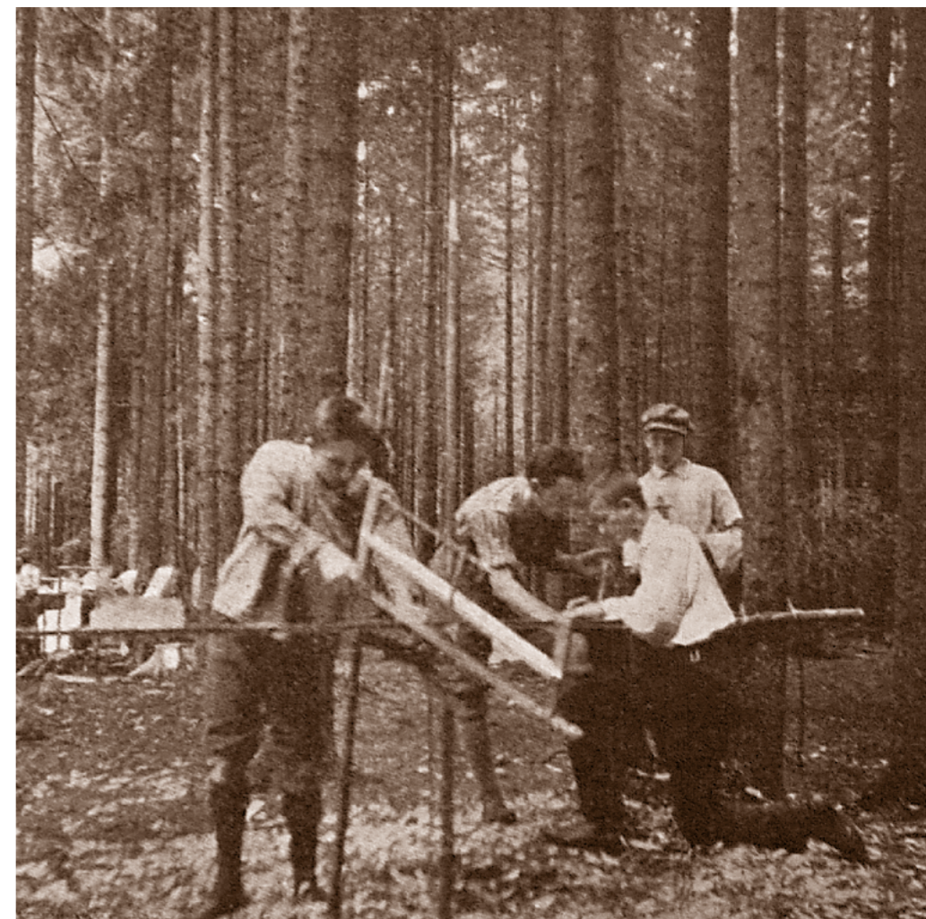
Truhlářská dílna ve stálém táboře, fotografie ze Svojsíkova tábora, rok 1912