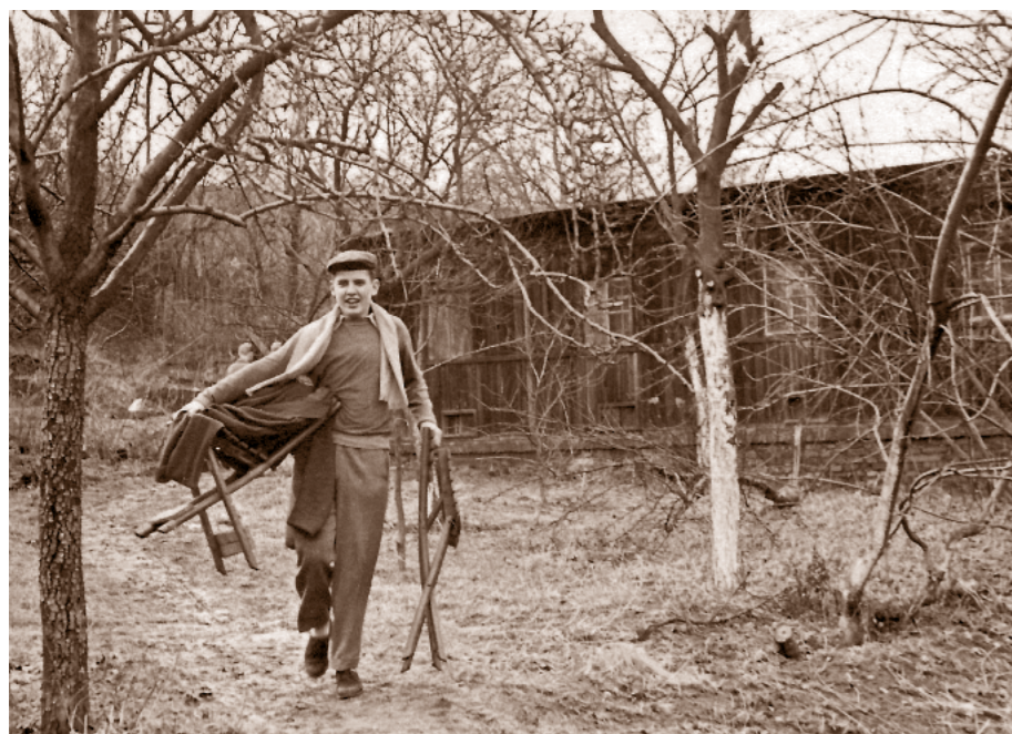
Do Radlic jezdili kluci z celé Prahy na konečnou tramvaje č. 18.

a nošení věcí odkazujících na skauting. Komunisté o Foglarově činnosti museli vědět, byl i pravidelně vyslýchán a sledovalo se, s kým se stýká.