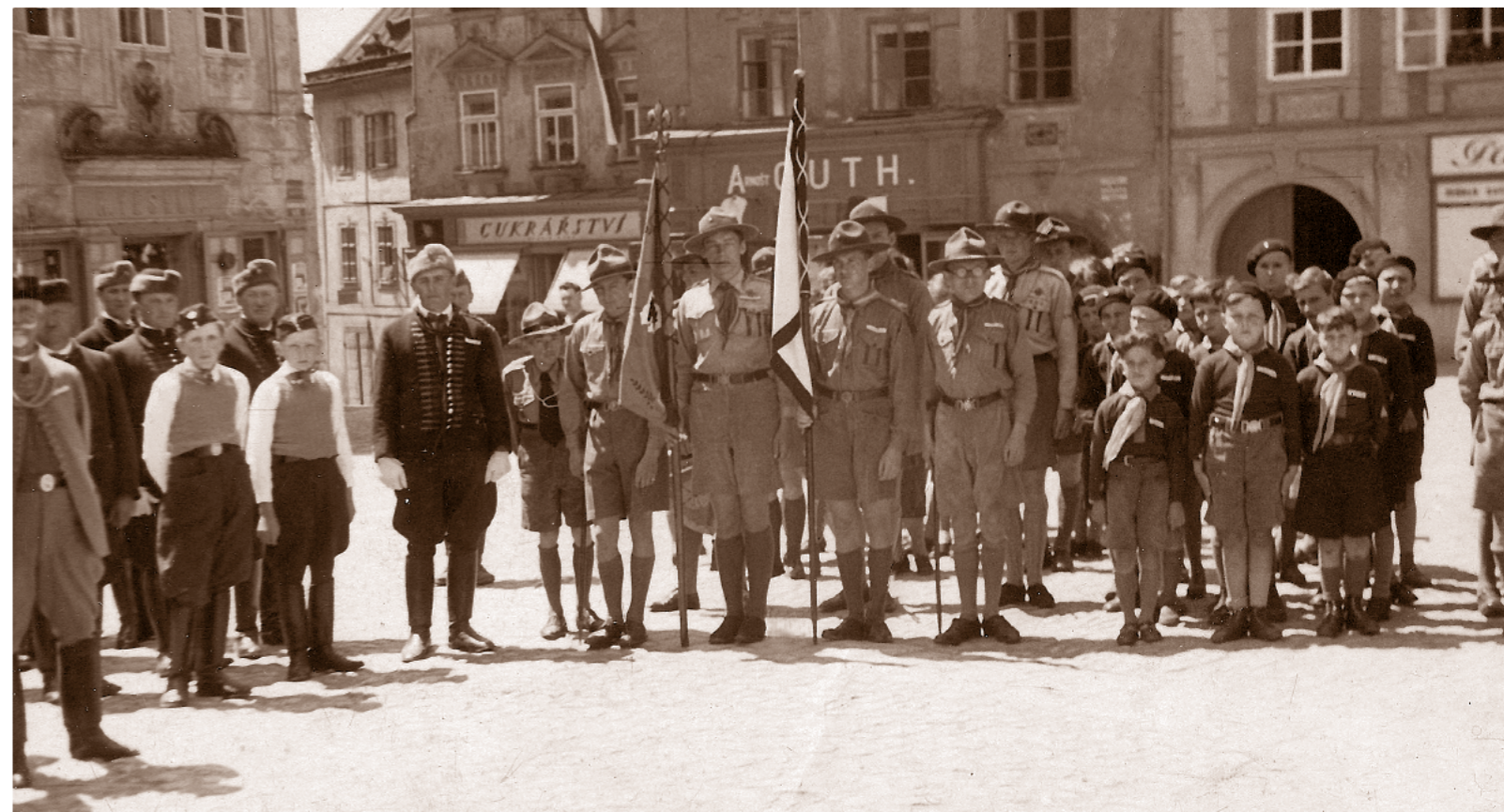
Skauti a sokolové na náměstí ve Strakonicih v roce 1930

Žádná výraznější reakce na sokolské rozhodnutí není známá, ale vyjádřila se k němu menší levicová organizace Sdružení československých