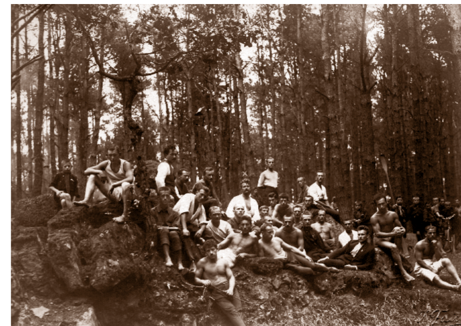
Antonín Benjamin Svojsík (označen křížkem) na sokolském cvičitelském kurzu v roce 1912

Přesvědčovat musel Svojsík pochopitelně konzervativní křídlo. Začal tak postupně vyvracet jejich argumenty, neboť míst na táboření mělo být dost, k němu pak mělo docházet o víkend, kdy měla mládež dostatek času. Problémem neměla být ani finanční stránka, neboť to, co rodiče za děti vydali, když byly na výpravě, ušetřili doma. Vzhledem k tomu, že se skauting měl českému prostředí