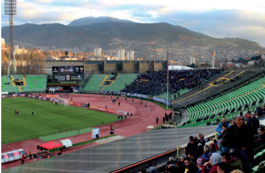
Olympijský stadion Zetra dnes při sarajevském derby

se konaly jak skoky na lyžích, tak běžecké a biatlonové závody. Též během samotných her se pořadatelé spoléhali na spolupráci Sarajevských. Od třetího dne akce totiž začalo hustě sněžit a dopravní kalamitu se údajně podařilo zažehnat jen díky tisícům lidí, kteří na výzvu městského rozhlasu začali uklízet chodníky. Zadostiučněním jim možná byla skutečnost, že se v obchodech po dobu her nabízelo netradiční zboží, například ananasy.