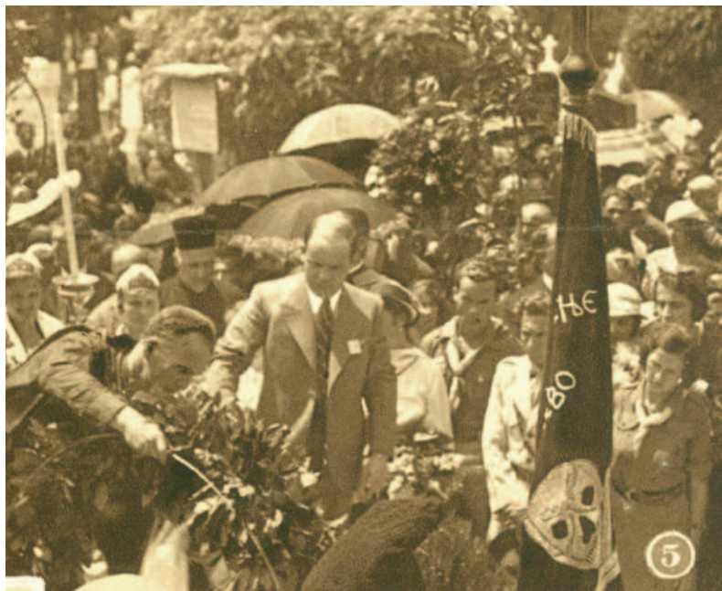
Sokolové na sletu v Sarajevu v roce 1934 u hrobů sarajevských atentátníků