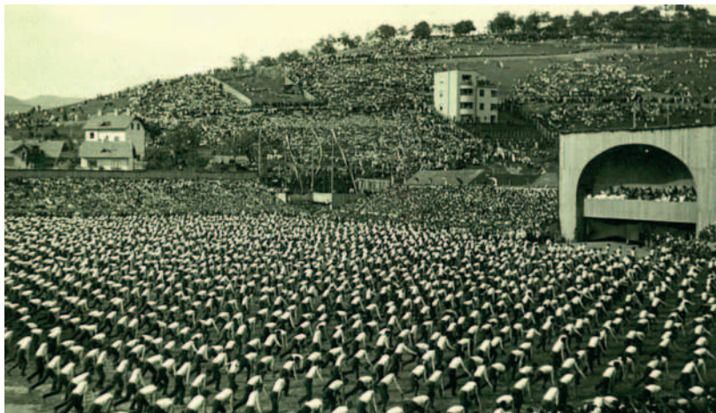
Slet v Sarajevu 1934