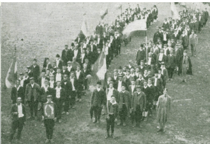
Sokolská četa z Nevesinje