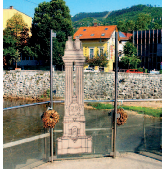
Skleněná tabule se zmenšeným vyobrazením pomníku obětem sarajevského atentátu u Latinského mostu