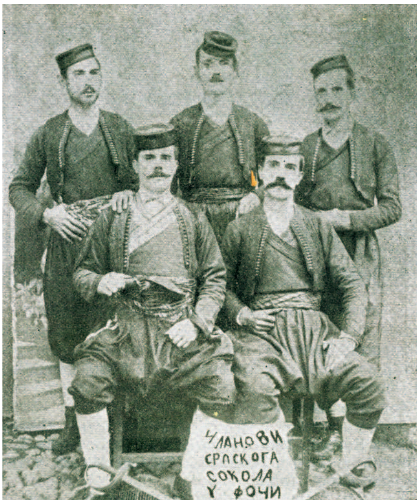
Sokolové ve Foči