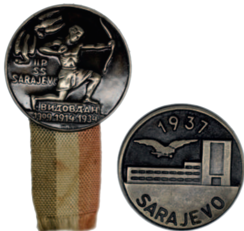
Odznak k otevření sokolovny