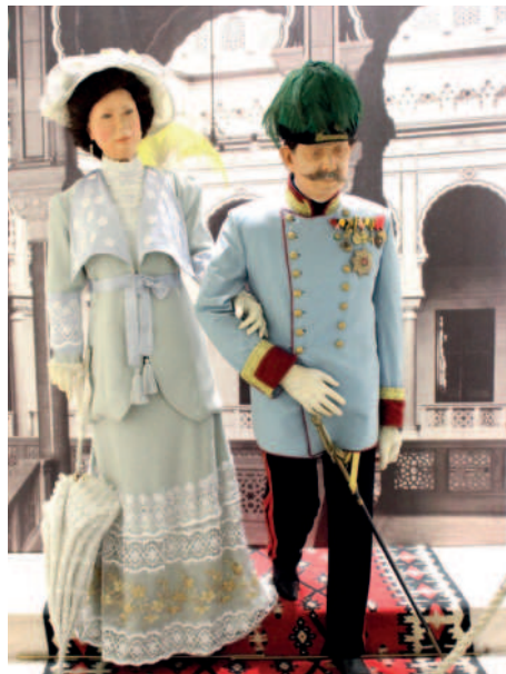
Figuríny následníka trůnu Františka Ferdinanda a Žofie v muzeu v Sarajevu