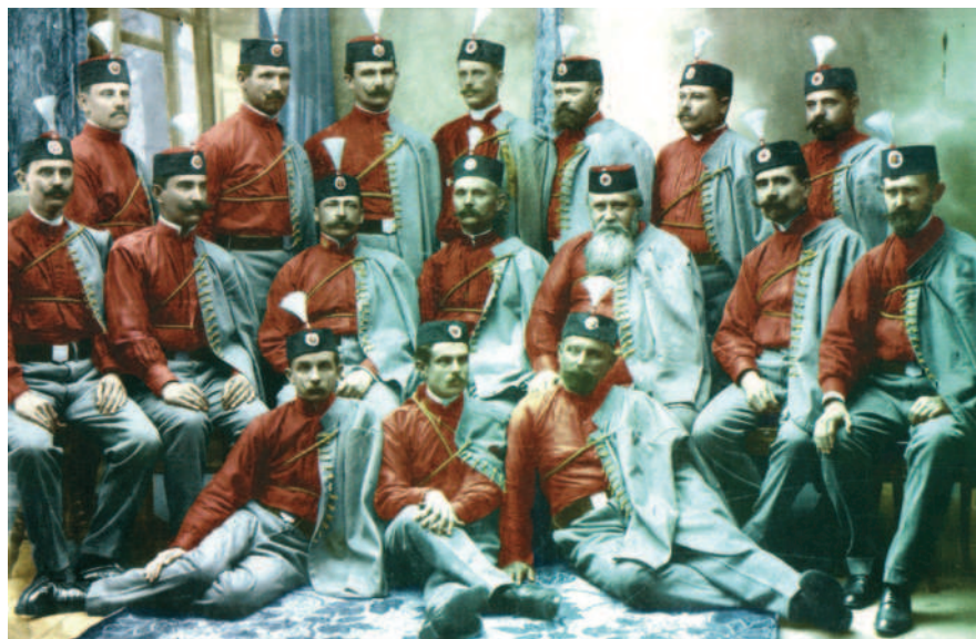
Kolorovaná fotografie sokolů v Srbsku z počátku 20. století