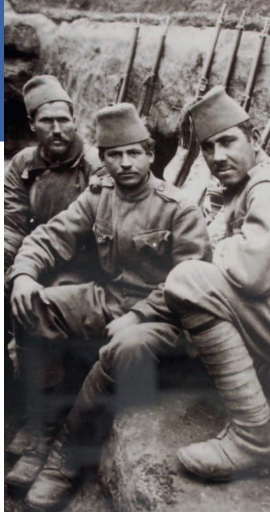
Bosenští vojáci v I. světové válce