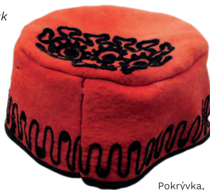
Pokrývka, kterou ke kroji nosily ženy