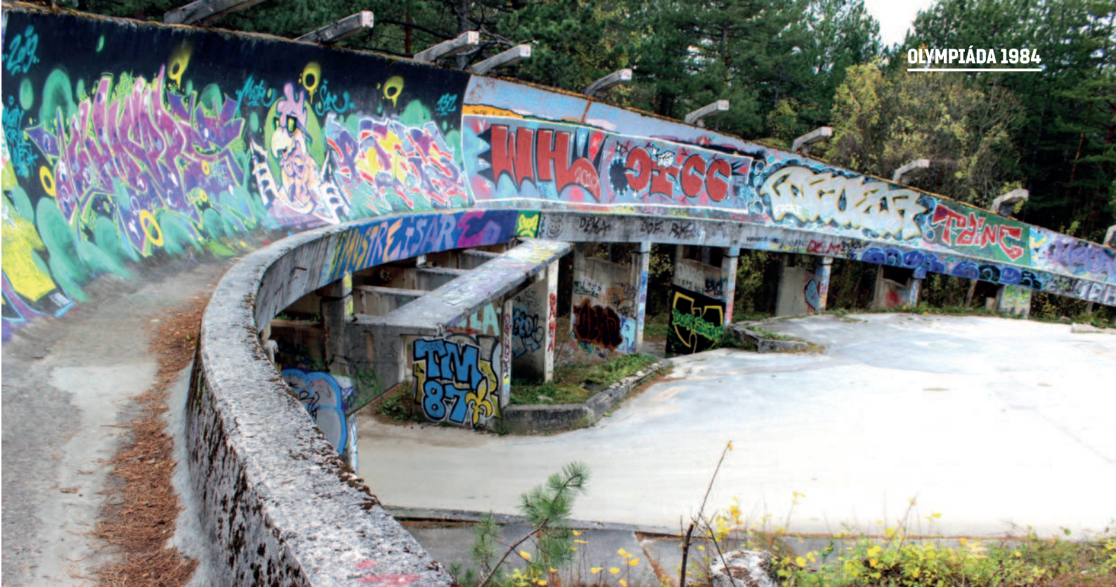
Bobová dráha nad Sarajevem