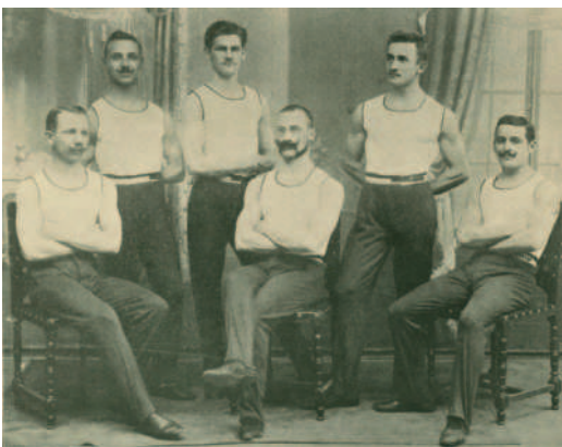
Oddíl chorvatského Sokola v Sarajevu