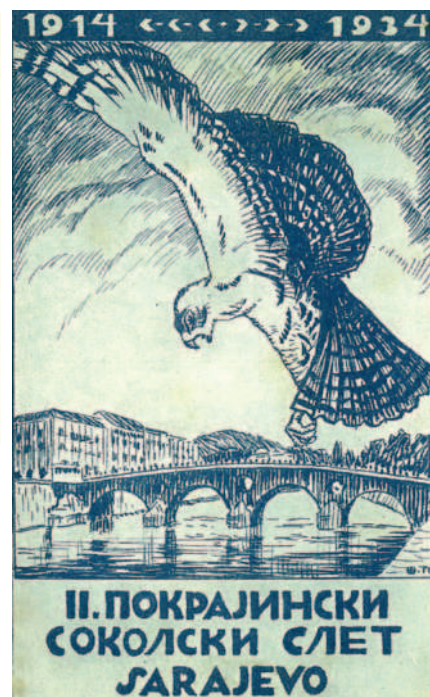
Seznam jednot v župě Sarajevo

69 stromů věnovaných králi a 32 Petrových hájů, odhalit 13 pomníků a 15 pamětních desek, zřídit 115 veřejných a 406 soukromých studní, 77 ulic, 82 nocleháren, 22 národních seřadišť, vysázet zeleninou 1094 zahrad, 494 ovocných sadů, obstarat 388 přeslic a 2400 včelích úlů, zřídit 18 ovocných školek a 8 sýpek, 834 hnojišť a pro 409 domů obstarat plivátka a rohože na boty. Bohužel zmíněná pětiletka začala v roce 1937, takže je téměř jisté, že tyto plány zhatila druhá světová válka. Po přečtení tohoto kuriózního výčtu nepřekvapí informace, že župa Mostar měla ve směru výchovy sokolstva v četách nejlepší výsledky, a proto na toto téma školoila členy z jiných žup. Čety se také účastnily různých sletů, jak výpravami, tak i společným cvičením. Díky podpoře od království se jim dostávalo finanční pomoci od ministerstev a mohly využívat bezplatně dopravu k sokolským činnostem. Jednotám i četám bylo k vytápění tělocvičen bezplatně přidělováno uhlí ze státních dolů. Pro hornatou a chudou Hercegovinu existovaly veřejné sbírky. Místní Sokol byl podporován též Československou obcí sokolskou, do Prahy v rámci různých stipendií jezdili jugoslávští sokolové.